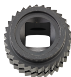
59191080 Juego de piezas de recambio para carraca