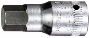
01120008 INHEX- Schraubendrehereinsat z