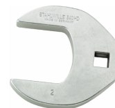
02501062 Kragefodsnøgle, heavy-duty