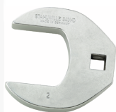
02501048 Kragefodsnøgle, heavy-duty