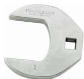
02501058 Kragefodsnøgle, heavy-duty