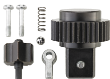
19070000 Knarren-Ersatzteil- Satz