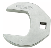
02501042 Crowfoot-Schlüssel heavy-duty