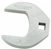
02501046 Crowfoot-Schlüssel heavy-duty