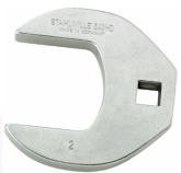
02501052 Crowfoot-Schlüssel heavy-duty