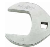
02501058 Crowfoot-Schlüssel heavy-duty