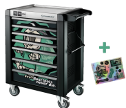
81200175 Werkstattwagen Sonderedition Best tools never die