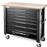
85010625 Mobile Werkbank