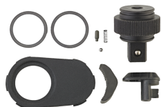
19010013 HI-LOK™ Knarren- Ersatzteil-Satz