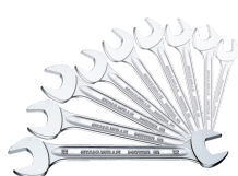
96400314 Doppelmaulschlüssel- Satz