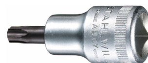
03100060 Schraubendrehereinsatz z