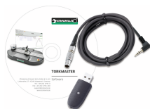
96583631 USB-adapter og kabel med software TorkMaster