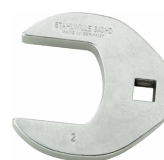
02501058 Kragefodsnøgle, heavy-duty