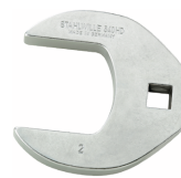
02501028 Kragefodsnøgle, heavy-duty