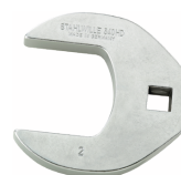
03501069 Kragefodsnøgle, heavy-duty