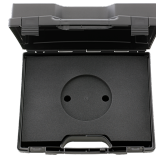
81500004 Kunststoffkasten, leer