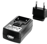
52110063 Netzteil USB