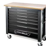
85010625 Mobile Werkbank