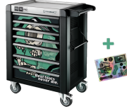
81200175 Werkstattwagen Sonderedition Best tools never die