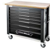
85010625 Mobile Werkbank