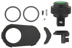
19012020 Knarren-Ersatzteil- Satz