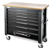
85010625 Mobile Werkbank