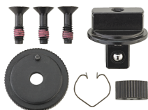
59251020 Knarren-Ersatzteil- Satz