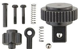
19040030 Knarren-Ersatzteil- Satz