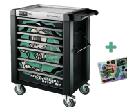
81200175 Werkstattwagen Sonderedition Best tools never die