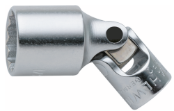
01540028 Gelenk- Steckschlüsseinsatz