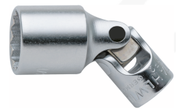
01540020 Gelenk- Steckschlüsseinsatz