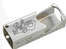
77301021 Flaschenöffner Sonderedition Best tools never die