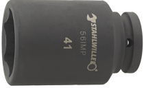
25020032 IMPACT top