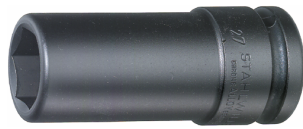
25090027 IMPACT top