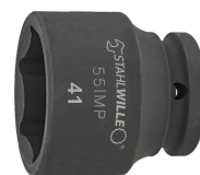
25010028 IMPACT top