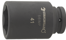
25020024 IMPACT top