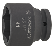
25010019 IMPACT top