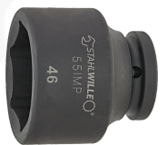
25010046 IMPACT top