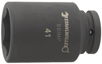
25020022 IMPACT top