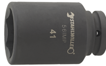
25020027 IMPACT top