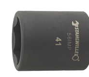
25020019 IMPACT top