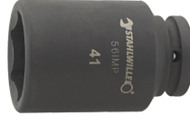
25020036 IMPACT top