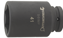
25020030 IMPACT top