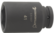
25020046 IMPACT top