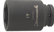
25020041 IMPACT top