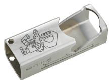
77301021 Flaschenöffner Sonderedition Best tools never die