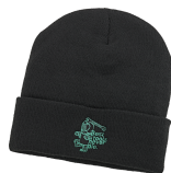
91970867 Beanie Sonderedition Best tools never die