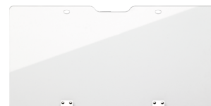
89010100 Gennemsigtigt cover