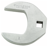
03501064 Crowfoot-Schlüssel heavy-duty