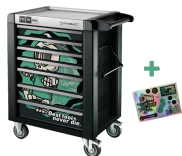
81200175 Werkstattwagen Sonderedition Best tools never die