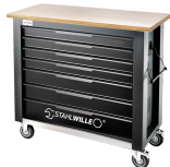
85010625 Mobile Werkbank