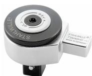
58250065 Feinzahn- Einsteckknarre