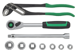
96830278 Werkzeug- Ergänzungsset AGRAR MOBIL