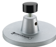
52110162 Auflage f.Dockingstation Nr.7762