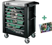
81200175 Werkstattwagen Sonderedition Best tools never die