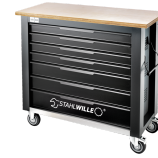
85010625 Mobile Werkbank