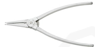
65454102 Sicherungsringzange f. Außenringe