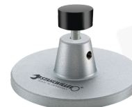
52110162 Auflage f.Dockingstation Nr.7762