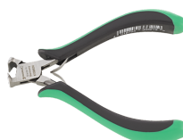
67096000 Elektronik- Vornschnneider