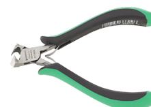
67106000 Elektronik- Schrägschnneider