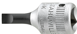
01280006 Schraubendrehereinsatz z