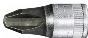
01290003 Schraubendrehereinsatz z