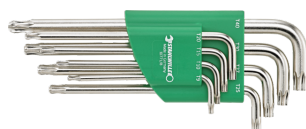
96432700 TORX® Kugelkopf- Winkelschraubendre- her-Satz