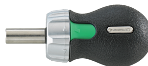
18120002 Bit- Ratschenschraubendre- her