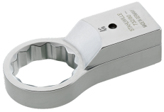
58228027 Ring- Aufsteckwerkzeug