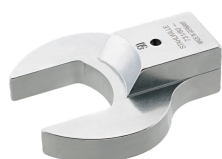
58218027 Maul- Aufsteckwerkzeug