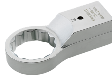
58228032 Ring- Aufsteckwerkzeug