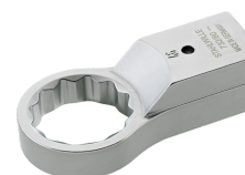
58228024 Ring- Aufsteckwerkzeug