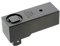
58240080 Vierkant- Aufsteckwerkzeug