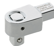
58241004 Vierkant- Einsteckwerkzeug