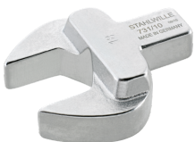
58211009 Maul- Einsteckwerkzeug