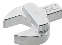
58211012 Maul- Einsteckwerkzeug