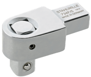
58241005 Vierkant- Einsteckwerkzeug