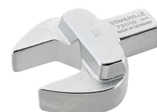
58211017 Maul- Einsteckwerkzeug