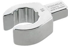
58231019 OPEN RING- Einsteckwerkzeug