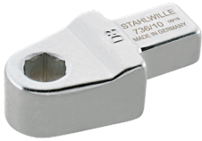
58262610 Bit-Halter- Einsteckwerkzeug