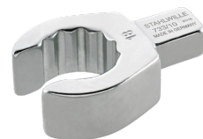
58231017 OPEN RING- Einsteckwerkzeug