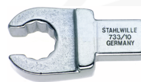
58231012 OPEN RING- Einsteckwerkzeug