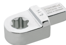
58291014 TORX® Einsteckwerkzeug