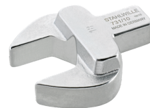
58611016 Maul- Einsteckwerkzeug