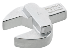
58611040 Maul- Einsteckwerkzeug