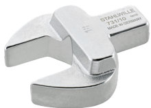
58211018 Maul- Einsteckwerkzeug