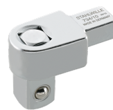
58240010 Vierkant- Einsteckwerkzeug