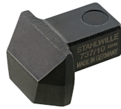
58270010 Anschweiß- Einsteckwerkzeug