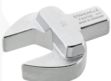
58211014 Maul- Einsteckwerkzeug