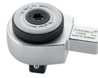
58250005 Feinzahn- Einsteckknarre