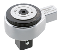
58250040 Feinzahn- Einsteckknarre