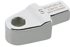
58261010 Bit-Halter- Einsteckwerkzeug