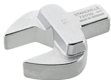
58211019 Maul- Einsteckwerkzeug