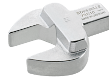
58211008 Maul- Einsteckwerkzeug