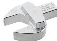
58611032 Maul- Einsteckwerkzeug