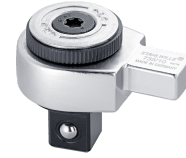
58250010 Feinzahn- Einsteckknarre