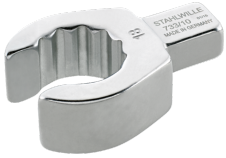
58231018 OPEN RING- Einsteckwerkzeug