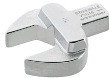
58211007 Maul- Einsteckwerkzeug