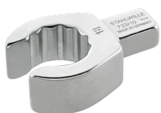
58231010 OPEN RING- Einsteckwerkzeug