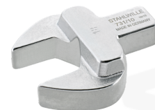
58211013 Maul- Einsteckwerkzeug