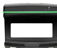
52110220 Bluetooth Low Energy