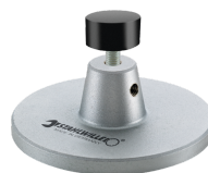
52110162 Auflage f. Dockingstation Nr.7762