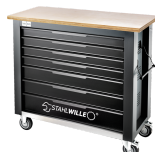
85010625 Mobile Werkbank