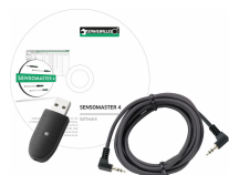
96583630 USB-Adapter und Klinkensteckerkabel m. Software SensoMaster 4