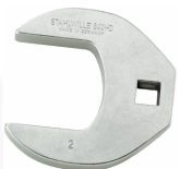
02501046 Crowfoot-Schlüssel heavy-duty