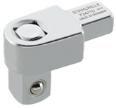
58240010 Vierkant- Einsteckwerkzeug