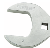
02501054 Llave de vaso Crowfoot Heavy-Duty