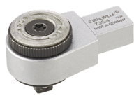
58250004 Carraca de inserción de dientes finos