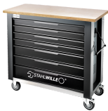
85010625 Mobile Werkbank