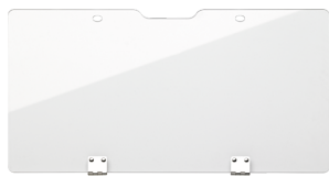
89010100 Transparente Abdeckung