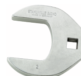
02501028 Crowfoot-Schlüssel heavy-duty