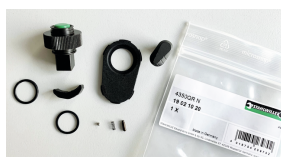
19021020 Knarren-Ersatzteil- Satz