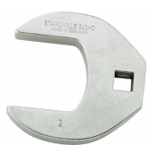
03501064 Crowfoot-Schlüssel heavy-duty