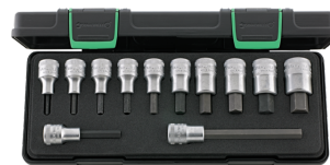
96031503 Satz Schraubendrehereinsät- ze INHEX