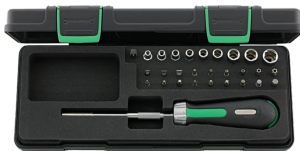
96182203 Bit- Ratschenschraubendre- her-Satz