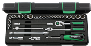
96010107 QuickRelease- Steckschlüsselsatz